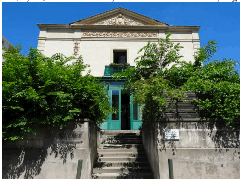
Façade de la villa des Rosiers

À 10 h, au 3 rue de Castelnau, devant la Villa des Rosiers, siège de la gestapo pendant l'occupation,