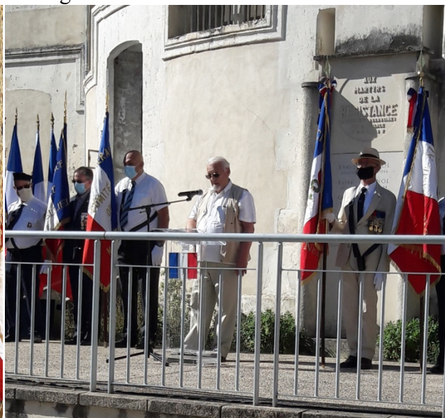
Devant l'entrée des geôles de la milice, caserne de Lauwe